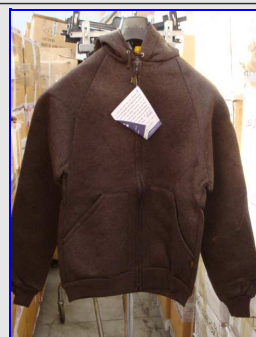
Felpa Termica Donna Vintage Made in Italy